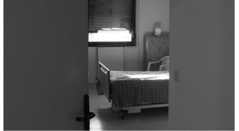
Photogrammes vidéo "6789C"